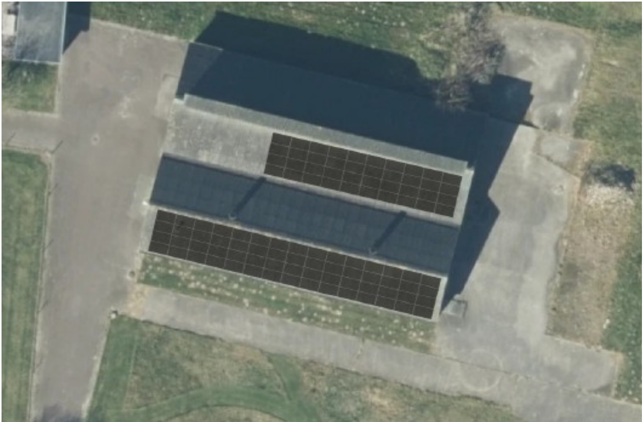
Impressie dakindeling project Bruinenburg

Aanbieding en uitgifte van participaties voor de realisatie van zon op dak project Bruinenburg door Coöperatie vereniging ZonopWoudenberg U.A. (hierna te noemen ZonopWoudenberg ).